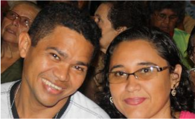
Mitarbeiterinnen und Mitarbeiter aus verschiedenen "comunidades"