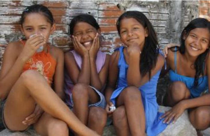
Kinder aus der Nachbarschaft