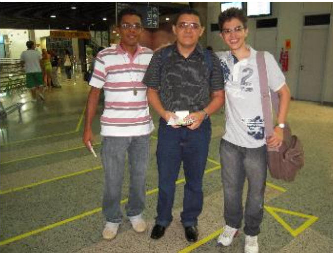
Junge Männer aus Itaitinga bei der Abreise ins Seminar der MSC (links)