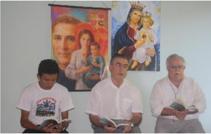
Beim Morgenlob mit Seminaristen in unserer Hauskapelle