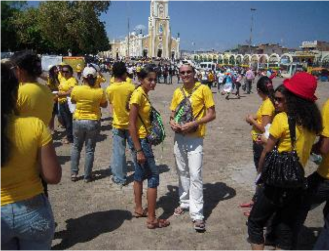
Bei der Sternwallfahrt der Katechisten in Juazeiro de Norte

Ein gesellschaftlicher und zugleich religiöser Höhepunkt für unsere freiwilligen KatechistInnen im Jahre 2009 war die Sternwallfahrt von neun Diözesen nach Juazeiro do Norte in unserem Bundesstaat Ceará. Es ist das Zentrum des volkstümlich schon längst als Heiligen verehrten Padre Cícero, der nur noch der kanonischen Heiligsprechung bedarf (oder auch nicht?).